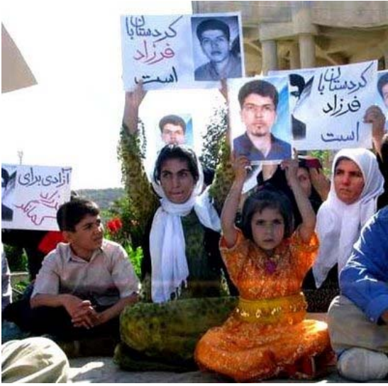
کردستان با فرزند است